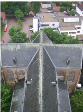
De gotische kerk is in kruisvorm gebouwd, het koor symboliseert de hemel, het schip de wereld.