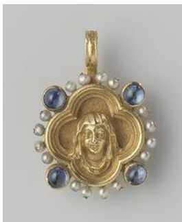
Hanger van goud, saffier en parels. Voorstellende een Madonna-kopje in een vierpas, in neo gotisch stijl.