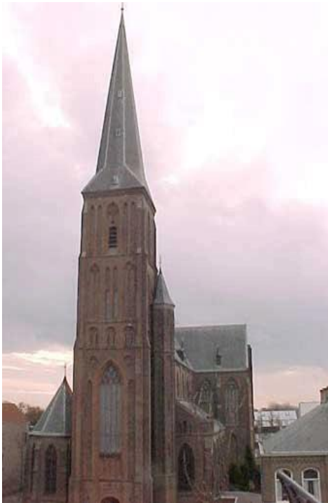
Christoforuskerk neogotiek met 70 meter hoge toren.

De gotisch bouwstijl begint omstreeks het jaar 1122. In de abdij van St. Denis bij Parijs, zet de bouwmeester van de kloosterorde der Cisterciënzers, Abt Suger, een grote verbouwing in gang. De abdij St. Denis met een prestigieuze kerk is de plaats waar de Franse koningen werden bijgezet sinds de 8e eeuw. Waar abt Suger zijn inspiratie voor de radicaal andere bouwwijze vandaan heeft, is niet geheel duidelijk. Waarschijnlijk onder invloed van de Kruistochten is de noodzakelijke kennis van de meetkunde van de Arabieren overgenomen, zodat men nu beter de belasting en overspanning kan berekenen en hoe een gebouw zich zal gedragen. Voorheen was de bouwwijze van een gebouw geheel bepaald door de ervaring van de architect, die ongeveer wist wat hij wel of niet kon bouwen. De gotische kerken hebben evenals de