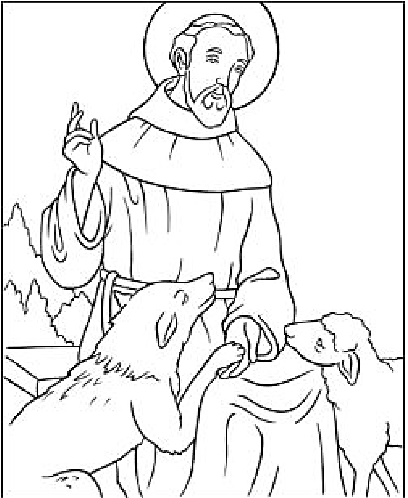
Saint Francis of Assisi