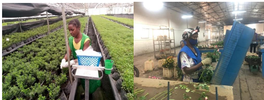
Hieronder, Plaatjes Fairtrade (2021)

Extra informatie/foto's/plaatjes: https://www.fairtradenederland.nl/nieuws/het-belang-van-een-fairtrade-floor-wage-voor-bloemenarbeiders/