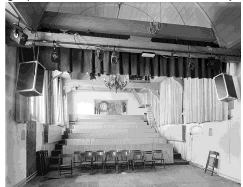
Foto 1 De kerk van Barsingerhorn was oorspronkelijk als RK gebouwd vanaf 1421 met als patroonheilige de H. Laurentius. Met de reformatie in 1573 is de kerk danig vernield. Na verloop van tijd is de kerk hersteld en is hij overgegaan naar Herv. Gemeenten Nederland. Door de zeer bouwvalige staat van de oude

De eerste kerk gebouwd in de 12 de eeuw op voorspraak van de Abdij van Egmond stond in het waterrijke Westfriesland in Zandwerven nabij Spanbroek tot 1480. Dit kerkje had als patroonheilige Maria Magdalena. Het kerkje stond hoog op een strandwal achter boerderij 'Storm en Donder'. Oude kaarten markeren de plek. Jammer genoeg is de kerk door een fikse storm verwoest en niet meer herbouwd. De kerkklok is overgegaan naar de kerk in Wadway waar hij nog steeds hangt. Sinds 1966 van de vorige eeuw na veel kritiek is deze kerk bekend geworden als theaterkerk Wadway. Veel artiesten hebben daar een optreden verzorgd. Verschillende kerken staan tegenwoordig open voor een meer cultureel gebruik van hun kerkgebouw, om financiële ruimte te creëren.