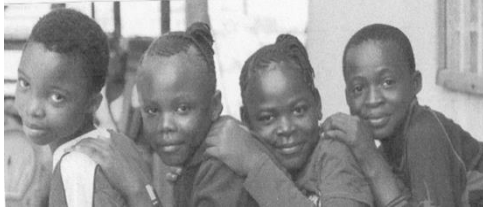
Opvang van straatkinderen in Congo

Wilt u een van deze projecten steunen? Uw bijdrage is enorm welkom. U kunt uw gift overmaken op rekeningnummer NL89 INGB 0653 1000 00 t.n.v. Adventsactie.