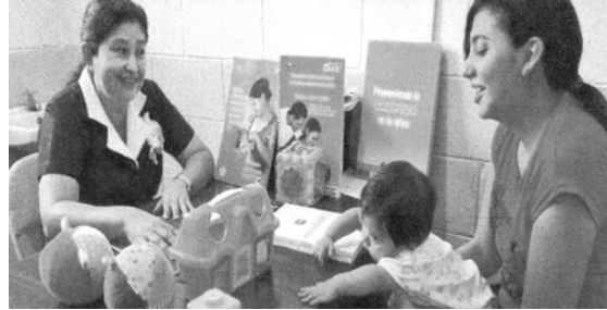
Vroege ontwikkeling van kinderen helpt tegen armoede in El Salvador